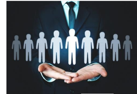
면접관이 꼽은 채용트렌드